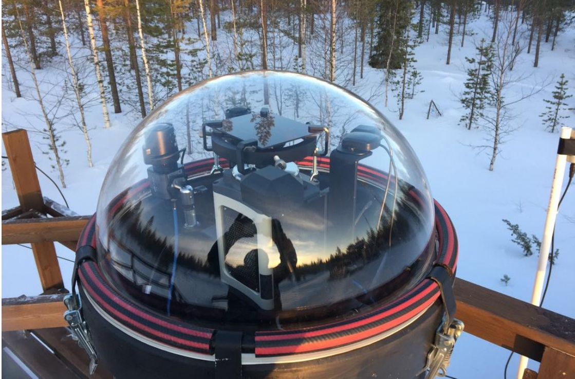
図 1: フィンランドのソダンキュラにおいて運用されている EMCCD 全天カメラ (中央部分)。 1 秒間に 100 枚のオーロラ画像を取得することができます。

本研究は、フィンランド北部のソダンキュラで運用されている高感度・高時間分解能の電子増倍型 CCD (EMCCD) 全天カメラ (図 1) と、同時刻に磁気圏を飛翔していた「あらせ」の観測データを組み合わせることによって実施されました。EMCCD 全天カメラは、コンピュータによる自動制御によって連続的に観測が行われていますが、本成果は、2017 年 3 月に「あらせ」がカメラの視野内において観測を実施した際に得られたデータを解析することによって得られました。