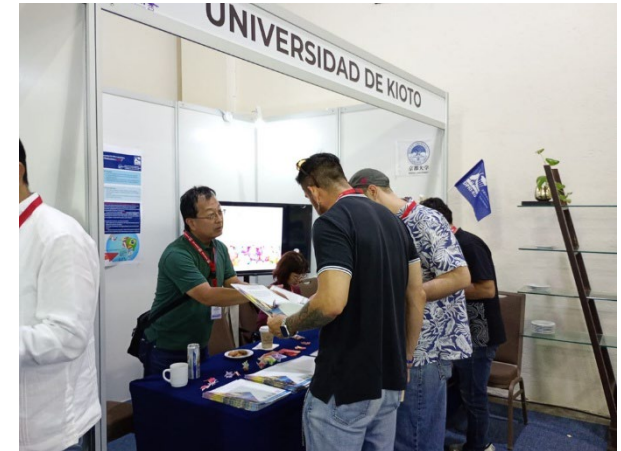
学会会場におけるブース展示